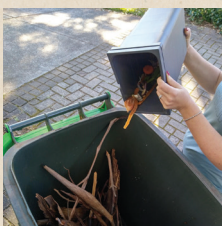
您不一定要用小垃圾箱或衬垫袋