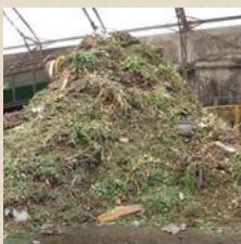
FOGO 可以用来制作堆肥