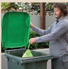
将袋子放进 FOGO 垃圾桶