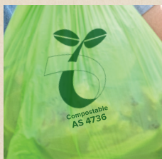
购买有 AS4736 编号的衬垫袋