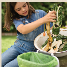
把所有的食物残渣都放在caddy里